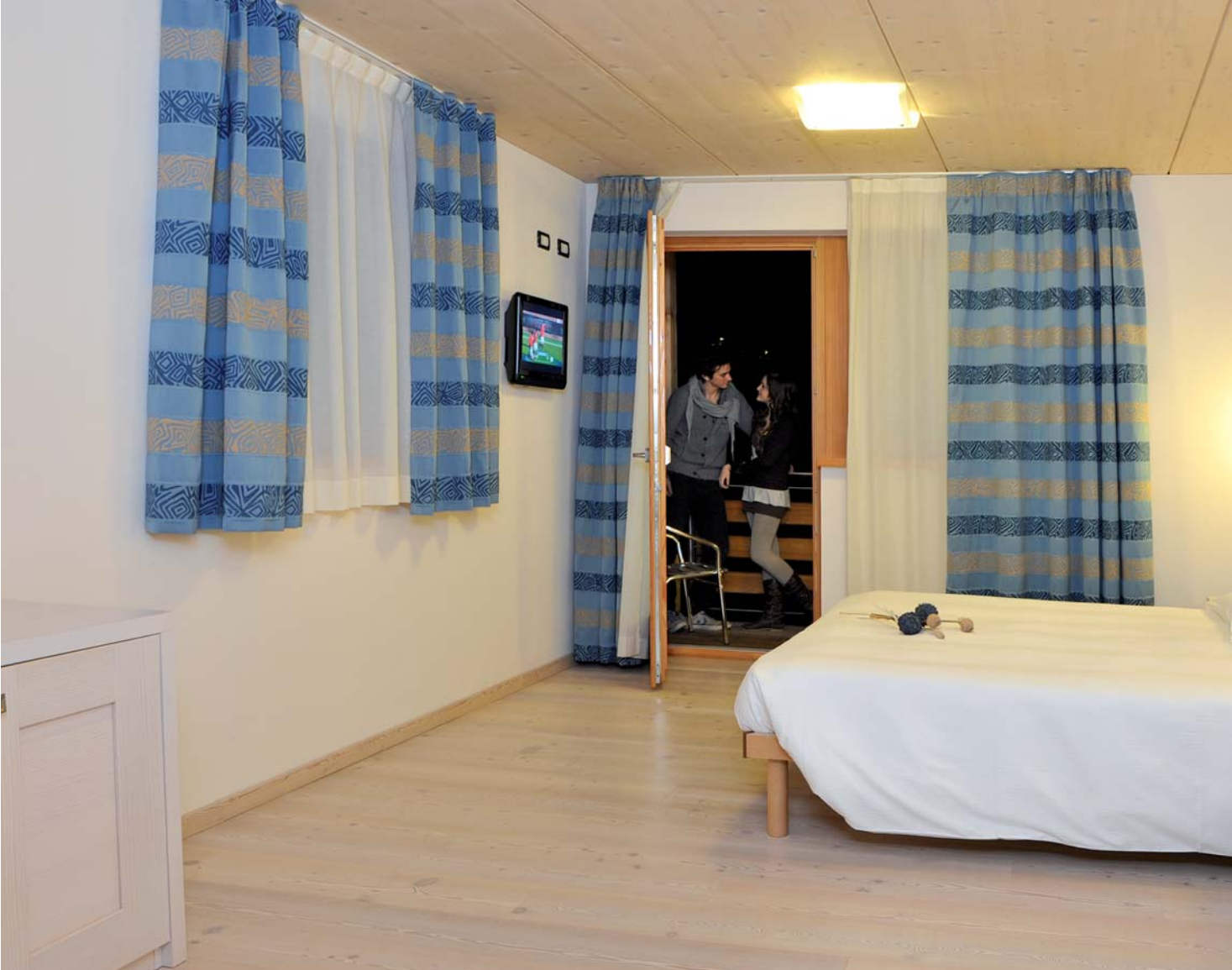
BIO WELLNESS PLUS ZIMMER BIO WELLNESS PLUS ROOM