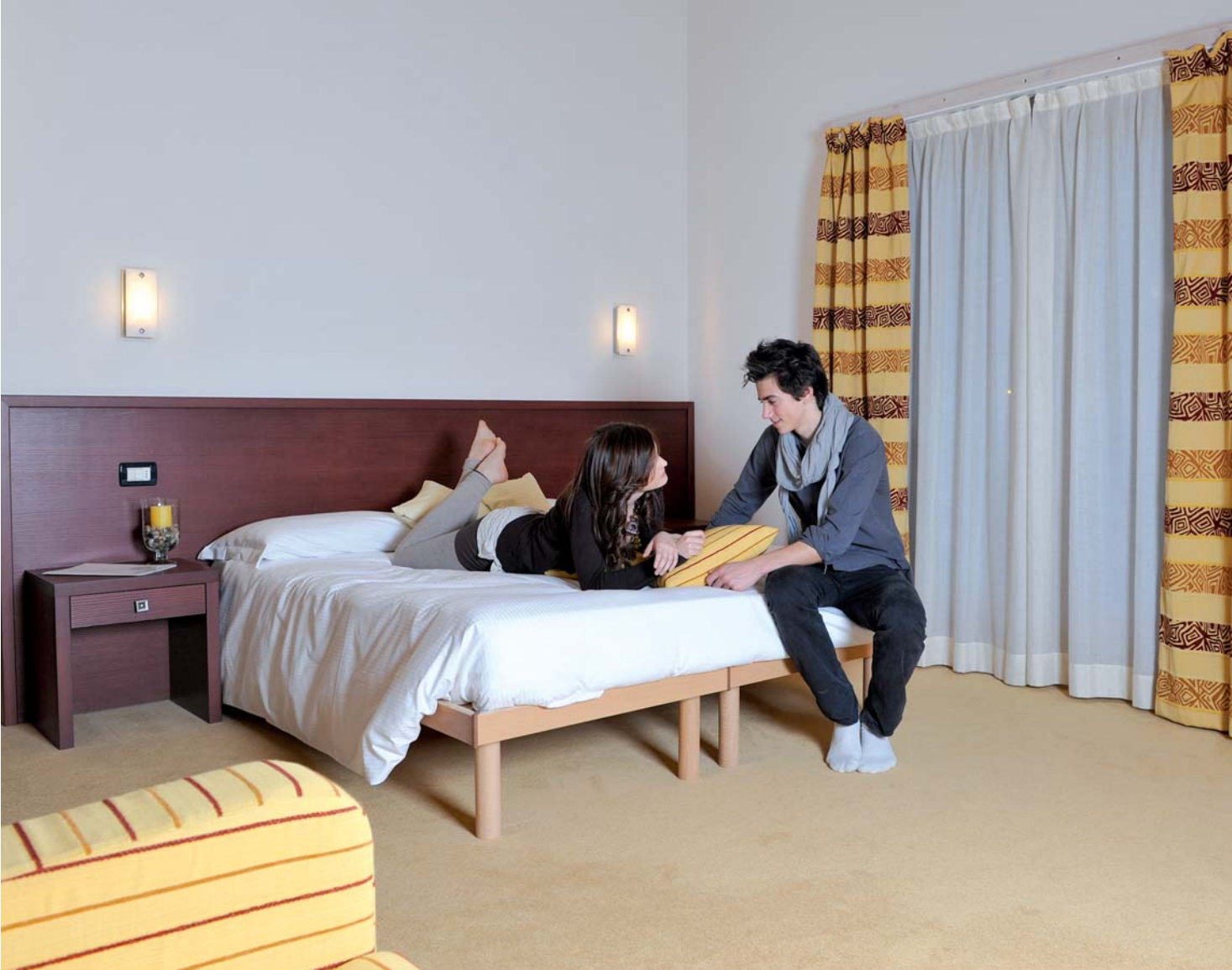
BIO SUN (SONNEN) ZIMMER BIO SUN ROOM